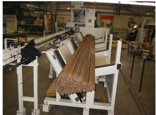
מזין אוטומטי לחבילות